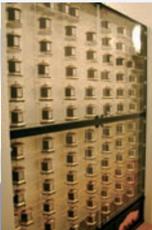
■特別骨壺供養棚(1階)