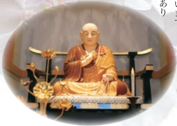
■本尊弘法大師坐像

です。その大きさは、五輪塔が5m、総高15mの大きさで、我が国最大級のものです。