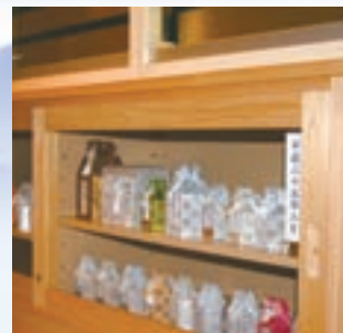
■お骨供養棚(回廊下段)