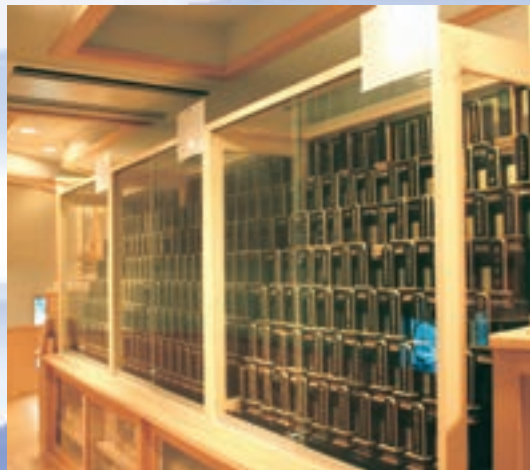
■特別位牌供養棚(回廊上段)